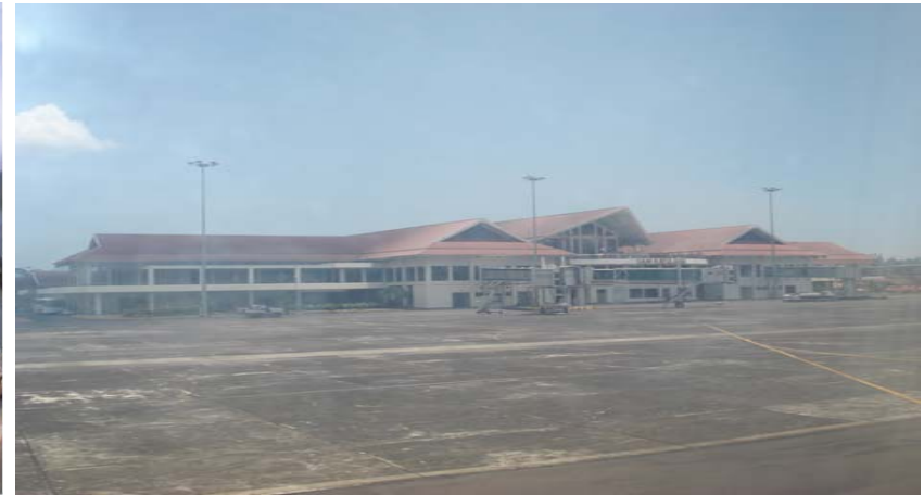
Lokasi Pertandingan Kerjasama Di Udara Bandara Sam Ratulangi