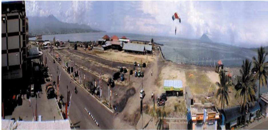
Lokasi Pertandingan Ketepatan Medarat Boulevard, Mega Mas